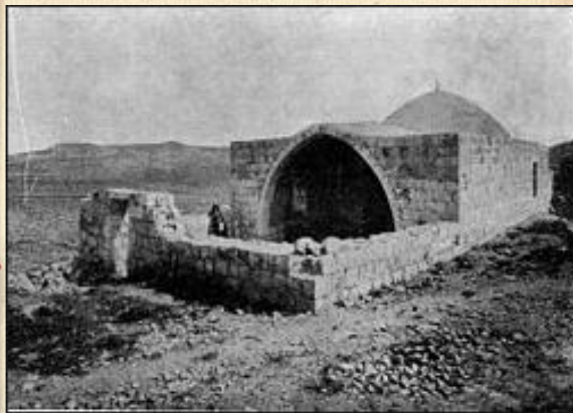
Natural Amphitheater at Shechem

Scientists have tested this natural amphitheater many times and it works